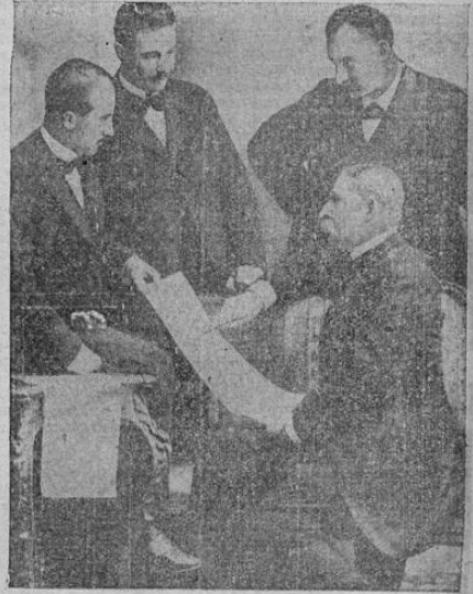
Fotografía tomada justamente antes de iniciarse la expedición del Dr. Andree al Polo Norte, en globo. El doctor Andree aparece sentado a la derecha y los demás son sus compañeros en la expedición